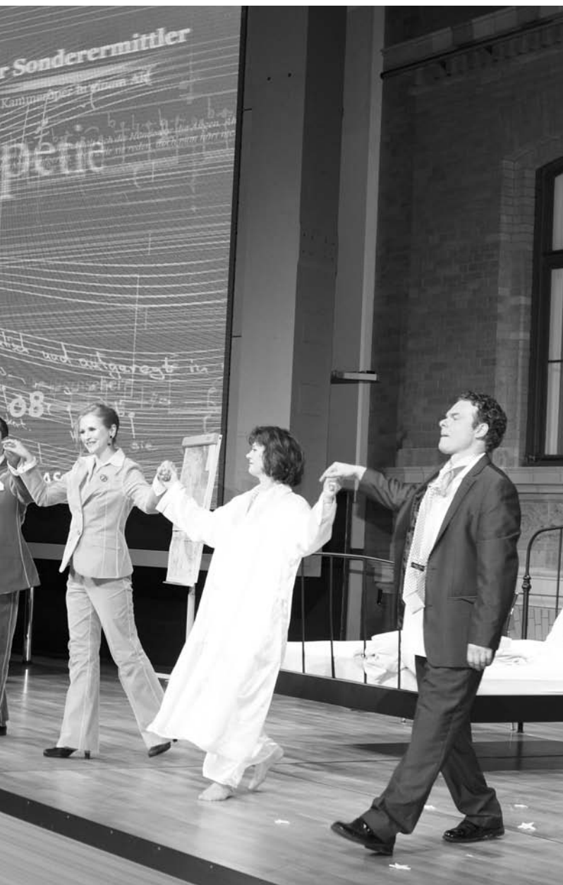
Berliner Opernpreis o8 - Gala zur Preisverleihung in der Hauptstadtrepräsentanz der Deutschen Telekom