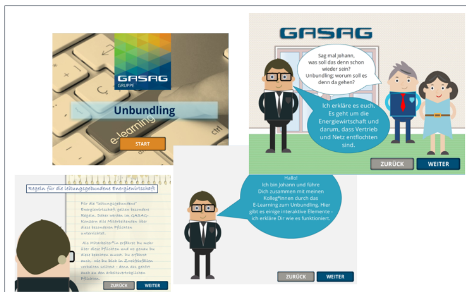
Abbildung 1: e-learning-Programm der GASAG-Gruppe

Die Durchführung der elektronischen Wiederholungsschulung kostet den Mitarbeiter ca. 60 Minuten. Das Programm ist in den Aus- und Weiterbildungskatalog der GASAG-Gruppe integriert und erinnert die Mitarbeiter automatisch über den Arbeitsplatzrechner, bis wann eine Wiederholungsschulung zur Einhaltung des 2-Jahres-Turnus durchzuführen ist.